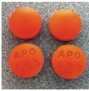
布洛芬 (与米索前列醇片一起服用)