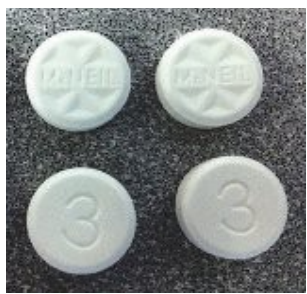
泰诺3号 (与食物一起服用)